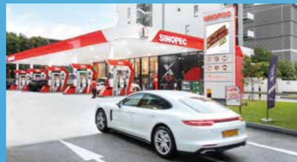
新加坡武吉知马加油站