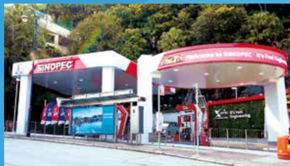
香港山顶道加油站

截至 2021 年底，中国石化为社会提供 17,131 万吨成品油（不含香港），2.8 万余家便利店，每天为约 2,000 万人次提供优质服务。在香港拥有 54 座油气站、2 个油库。在新加坡拥有 3 座加油站。